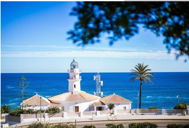
FARO DE CULLERA

Llegados a este punto, aquellos que tengan que volver para comer en casa podrán coger fácilmente la AP-7 en cualquier dirección; para los demás tendremos la opción de visitar el Asador de La Ribera , un establecimiento espacioso, con brasas y económico que nos permitirá aparcar nuestras motos en la puerta y disfrutar de la comida y sobremesa hasta que decidamos regresar.