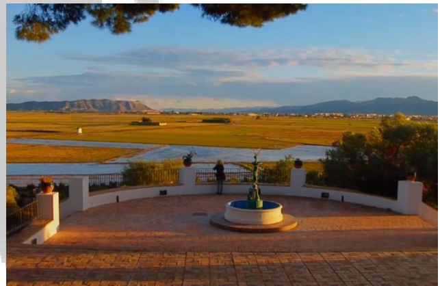
MUNTANYETA DELS SANTS