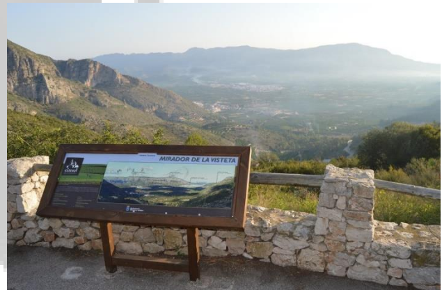
MIRADOR DE LA VISTETA