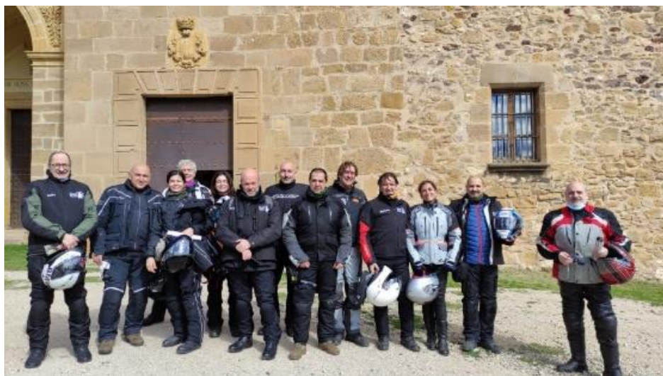
En Esteruel se encuentra el Monasterio de Nuestra Señora del Olivar .